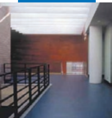
Пример укладки линолеумного покрытия поверх выравнивающей массы Ultraplan. Консерватория Монсон - Испания

Вся необходимая справочная информация по материалу доступна по запросу, а также на сайте www.mapei.com