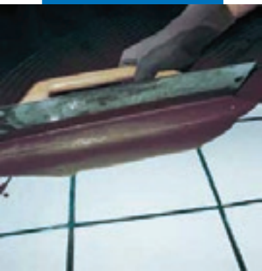
Нанесение Ultraplan металлическим мастерком поверх старых керамических полов после предварительной обработки составом Mapeprim SP