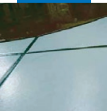
Деталь применения Ultraplan на строящемся керамическом полу после предварительной обработки составом Mapeprim SP