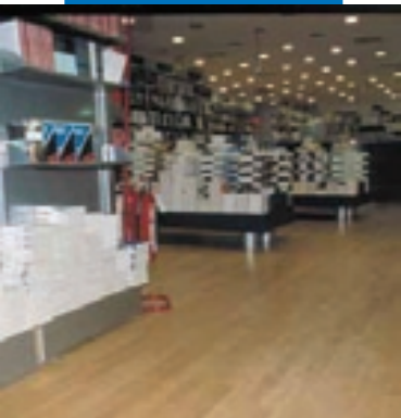
Пример укладки дерева поверх выравнивающей массы Ultraplan. Музыкальный магазин «Мессаджерие Музикали» - Рим - Италия