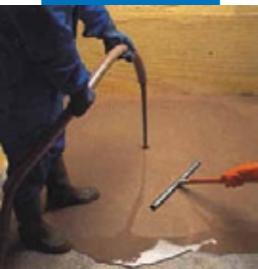
Нанесение Ultraplan насосом с последующей обработкой скребком