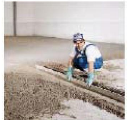
Подготовка к выравниванию.

Если стяжка из ТОРCEM пересекается трубами, то необходимо уложить над ними армирующую сетку из тонкой проволоки (не более чем 30x30 мм). Тонкую арматурную сетку не