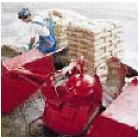
Приготовление смеси с ТОРCEM.

ТОРCEM 200- 250 кг/куб.м. Фракционные наполнители (0-8мм) – 1650-1800 кг/куб.м.