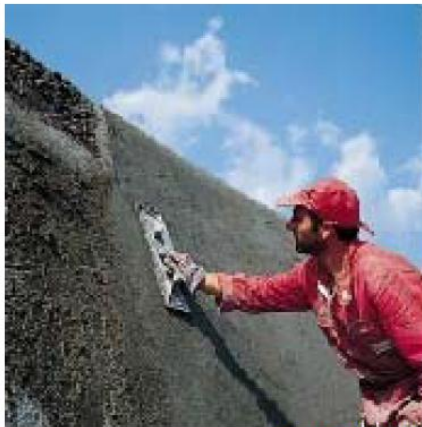
окончательная отделка MAPEGROUT T40

эффективности основание укрепляется арматурой или опалубкой. При толщине слоя более 2 см MAPEGROUT T40 можно использовать без опалубки, только если поверхность была сделана шероховатой и использовалась арматура. Арматуру должен закрывать слой толщиной не менее 1 см. Слои меньшей толщины можно наносить без арматуры, при условии, что поверхность достаточно шероховата для компенсации расширения.