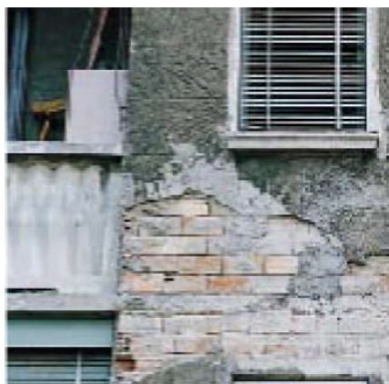
фасад здания, нуждающийся в ремонте

ржавчины, остатков цемента, жира, масел, старой краски и т.д.