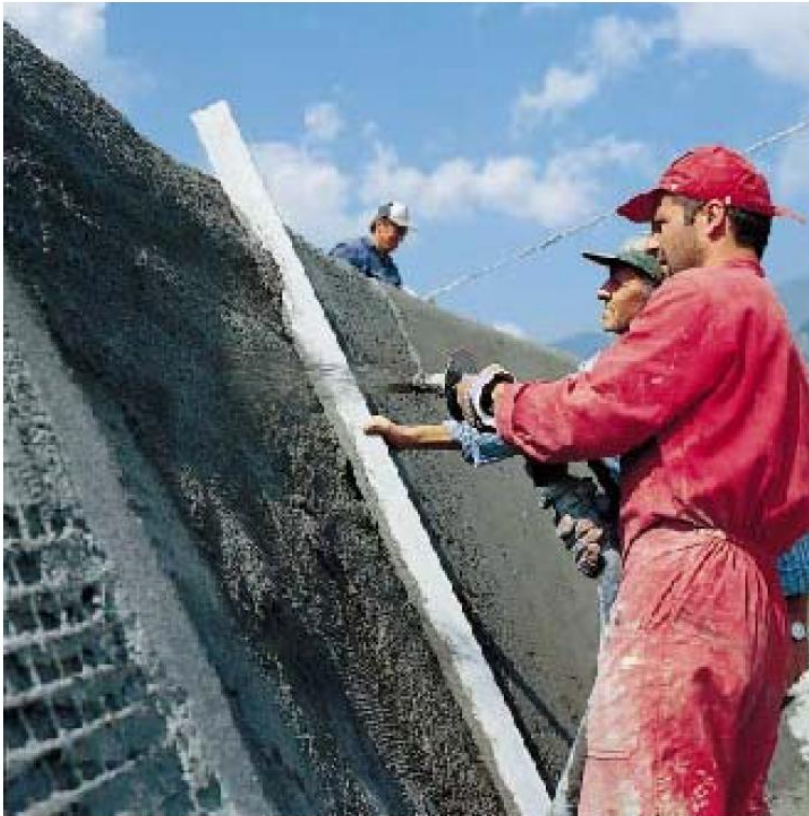
нанесение MAPEGROUT T40 распылением